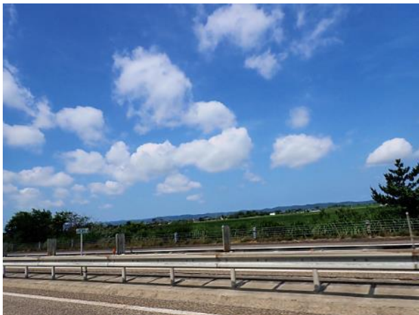
写真 481. 天気は回復

高速に乗ると急速に天気が回復して暑くなった。赤城高原サービスエリアまで一気に走り昼食とした。新潟の名物「へぎ蕎麦」があったので、食べた。榛名山等の群馬の山がきれいに見える。