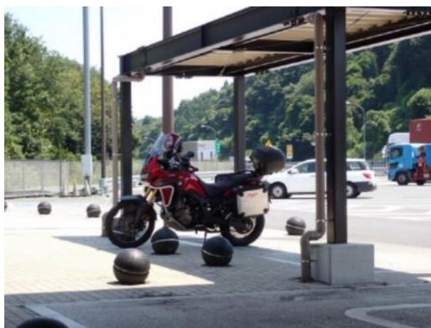
写真 486. 嵐山パーキングエリア

その後事故渋滞などもあって、帰宅は 15 時となった。約 3,500 キロの長旅の終わりである。