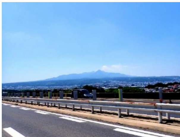
写真 484. 水沢山や榛名山等を望む

遂に、バイクの温度計が 39℃ となった。暑すぎて、嵐山パーキングエリアに待避してクールダウン。