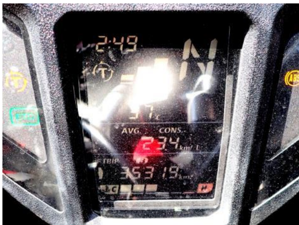
写真 487. 総走行距離 3,531.9 キロ

その後事故渋滞などもあって、帰宅は 15 時となった。約 3,500 キロの長旅の終わりである。