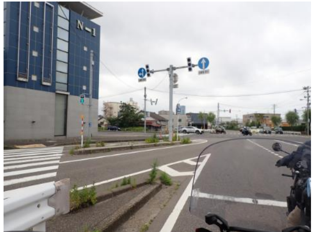
写真 480. 無事新潟に上陸も天気曇り

高速に乗ると急速に天気が回復して暑くなった。赤城高原サービスエリアまで一気に走り昼食とした。新潟の名物「へぎ蕎麦」があったので、食べた。榛名山等の群馬の山がきれいに見える。