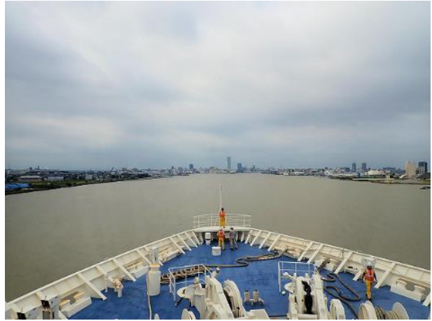
写真 478. 新潟港に入港