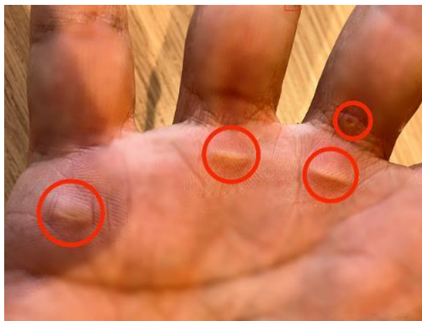
写真 488. アクセルタコができた