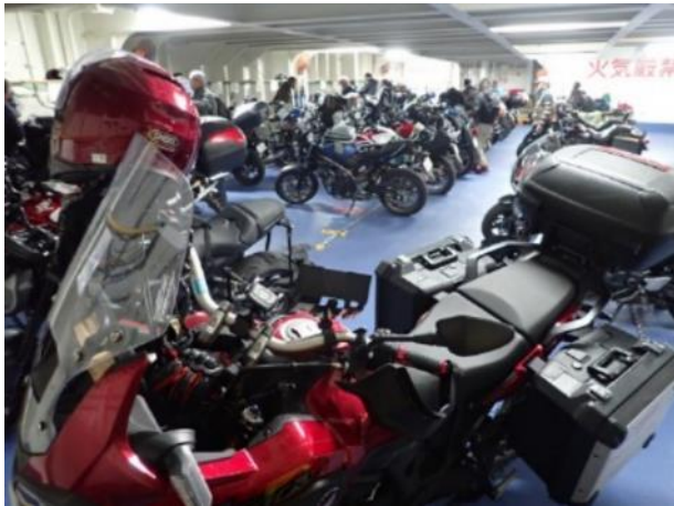
写真 479. 車両デッキ