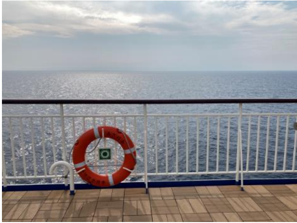
写真 477. 少し雲が出てきた