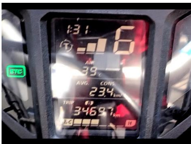
写真 485. 遂に気温が 39℃ になった

遂に、バイクの温度計が 39℃ となった。暑すぎて、嵐山パーキングエリアに待避してクールダウン。