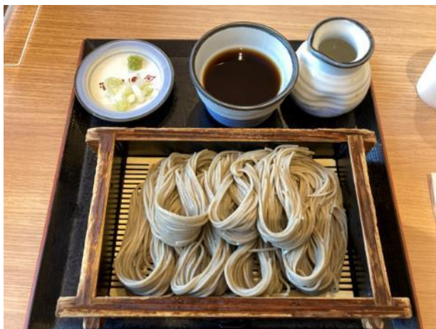
写真 483. へぎ蕎麦