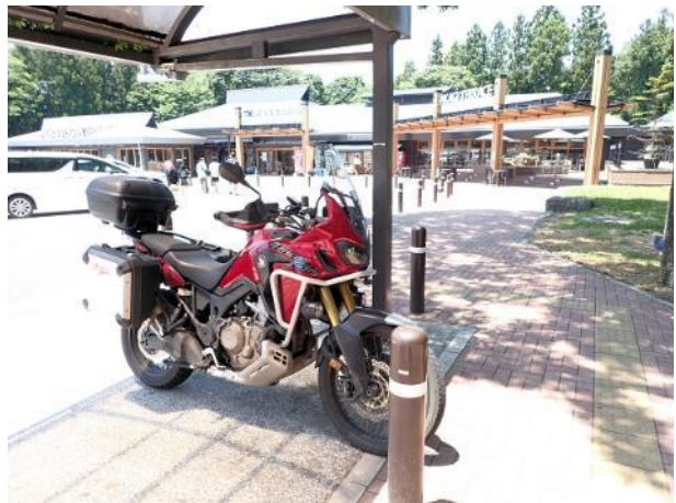
写真 482. 赤城高原サービスエリア