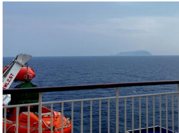
写真 476. 粟島を望む