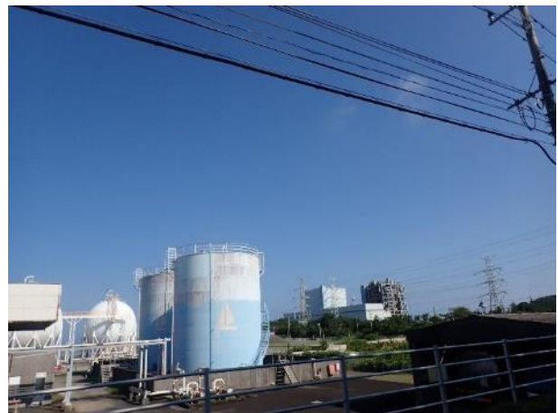
写真 364. 「サーキュラーパーク九州」

「サーキュラーパーク九州」をすぎてから、海岸の方を走ろうと進むと、グランピングドームが並ぶ唐浜海水浴場で行き止まり。この辺り、「ナミオテラスリゾート鹿児島」という高級リゾート施設が出来ている。少し引き返して、まだ田植えをしている田園地帯を抜けて国道 3 号にでた。この辺りから、「肥薩おれんじ鉄道」と並走する区間が、断続的に続く。