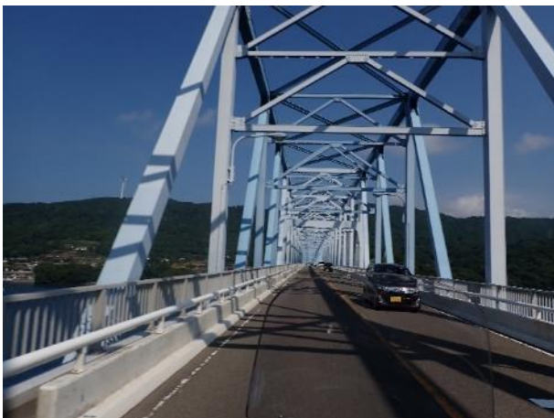
写真 369. 黒之瀬戸大橋

「牛之浜景勝地」等を横目に北上し、阿久根で国道 389 号に入り、黒之瀬戸大橋を渡って長島に渡った。そして、道の駅「黒之瀬戸だんだん市場」で U ターンして戻ってきた。ただ長島に渡ってみたかったです（笑）。