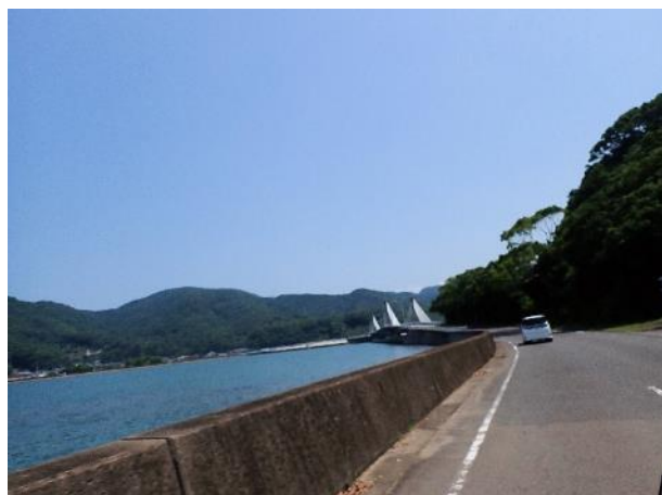
写真 381. 芦北大橋が見えてきた

ちゃんと「バイク天満宮」で交通安全を祈願してから、「七浦オレンジロード」を進んだ。この道は、2020 年の熊本豪雨で被災して、今年の 4 月にやっと全線修復が終わり開通したばかり。