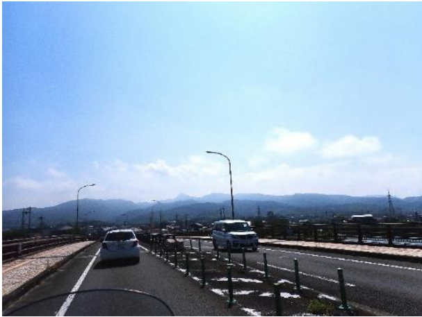
写真 371. 米ノ津橋