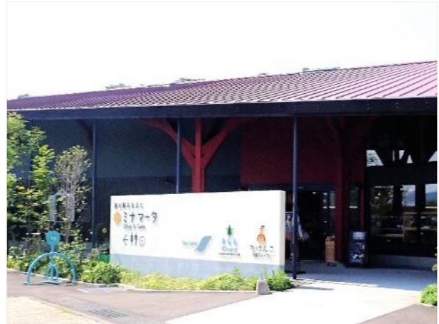
写真 376. 道の駅のショップ「ミナマーケット」