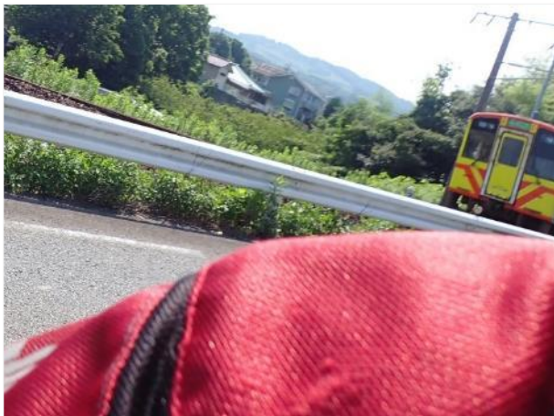
写真 373. 希少「肥薩おれんじ鉄道」だー！