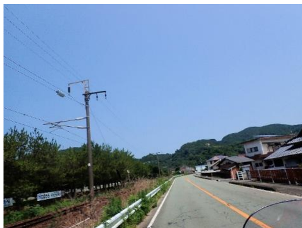
写真 382. 国道 3 号と肥薩おれんじ鉄道が並走