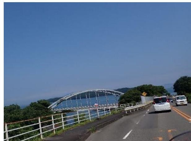
写真 374. 月の浦橋が見えた

希少な「肥薩おれんじ鉄道」の列車とやっとすれ違った。少し行くと、道の駅「みなまた」に着いた。「木のおもちゃ館きらら」が面白そうだったので、入ったら有料で子ども向けの木の遊具がある施設だったので、汗だくのバイクオヤジには、場違いだったので、脱出！ショップの「ミナマーケット」も軽く流し、水分補給だけして先を急ぐことにした。