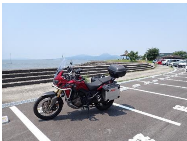
写真 394. 住吉海岸公園