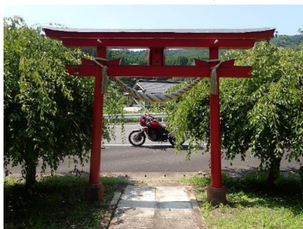
写真 380. バイク天満宮 (3)

ちゃんと「バイク天満宮」で交通安全を祈願してから、「七浦オレンジロード」を進んだ。この道は、2020 年の熊本豪雨で被災して、今年の 4 月にやっと全線修復が終わり開通したばかり。