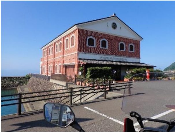
写真 359. 「薩摩藩英国留学生記念館」