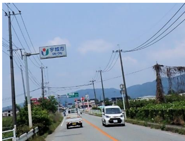
写真 392. 宇城市に入る

国道 3 号で宇城市に入り、隣の宇土市で国道 57 号に入る。遂に温度計が 37℃を示す。意識が遠のく暑さの中、住吉海岸公園に着く。