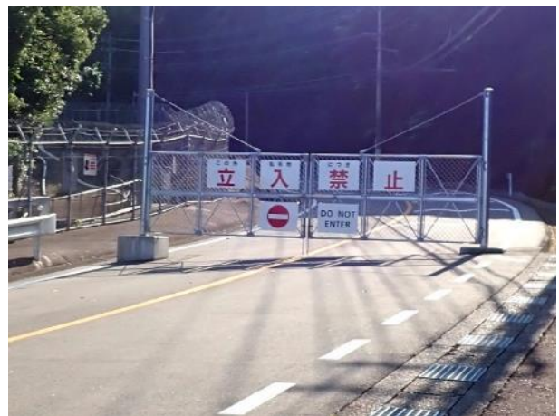
写真 362. 旧県道？は通行止め

川内河口大橋を渡り、県道 44 号を海岸線側に走ると川内火力発電所の跡地に、「サーキュラーパーク九州」が出来ていた。資源循環型のエネルギー生成事業を展開し始めているようである。