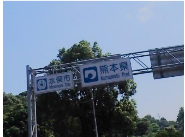
写真 372. 熊本県に突入