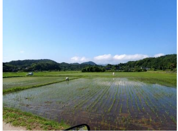
写真 366. まだ田植え中です