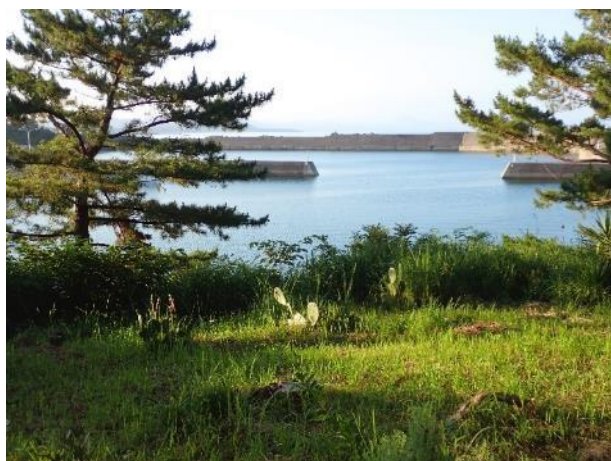
写真 353. 宿の庭は散歩が出来る

本日も快晴。この宿は、朝食が付いているので朝食まで周辺を散歩。目の前の海は、「くしきの長崎鼻公園」になっていて、子どもが喜びそうなプールが出来ている。シーズン前なのでまだ営業していなかった。薩摩半島には、二つの「長崎鼻」があるのを初めて知った。宿の倉庫の裏に、ご飯を食べに猫が歩いてきた。昨日の看板猫といい、皆この辺で面倒見で貰っているようである。他にも数匹見かけた。