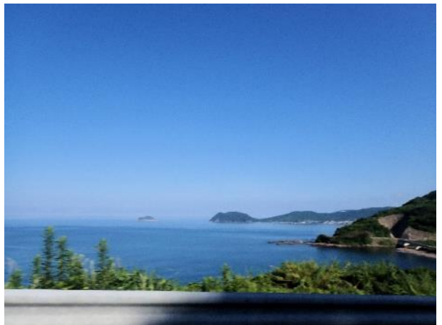
写真 358. 羽島の岬と薩摩沖ノ島

「薩摩藩英国留学生記念館」の建物が有名なので、開館前だったが寄ってみた。レンガ造りのきれいな建物だった。県道をそのまま進むと、山の尾根には風力発電の風車が並んでいた。その先は、川内原子力発電所がある。展示館もまだ開館前なので、スルー。その後、地図では海岸寄りの道を進めるようになっていたが、通行止めになっていた。山側に新しく県道が作られていた。原発のセキュリティーのために県道を離れたのだろうか？