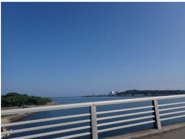
写真 363. 川内河口大橋を渡る

川内河口大橋を渡り、県道 44 号を海岸線側に走ると川内火力発電所の跡地に、「サーキュラーパーク九州」が出来ていた。資源循環型のエネルギー生成事業を展開し始めているようである。