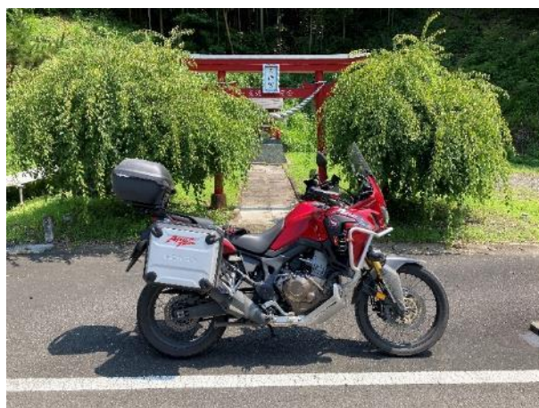
写真 378. バイク天満宮 (1)