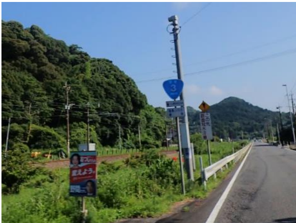
写真 367. 国道は「肥薩おれんじ鉄道」と並走