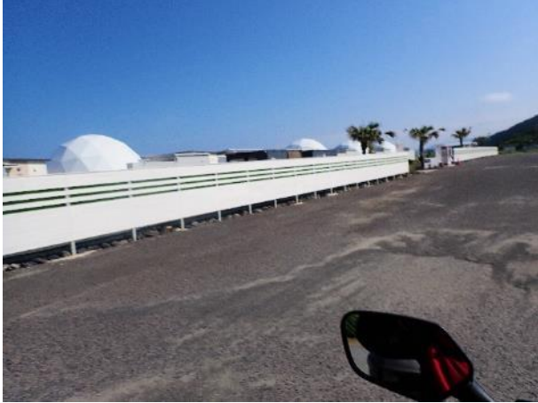
写真 365. 「ナミオテラスリゾート鹿児島」