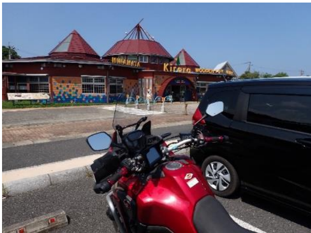
写真 375. 「木のおもちゃ館きらら」

希少な「肥薩おれんじ鉄道」の列車とやっとすれ違った。少し行くと、道の駅「みなまた」に着いた。「木のおもちゃ館きらら」が面白そうだったので、入ったら有料で子ども向けの木の遊具がある施設だったので、汗だくのバイクオヤジには、場違いだったので、脱出！ショップの「ミナマーケット」も軽く流し、水分補給だけして先を急ぐことにした。