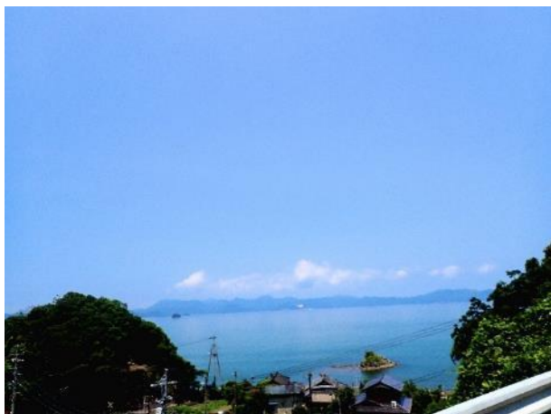
写真 383. 小島（波多島）と対岸は天草

「七浦オレンジロード」の終点からしばらく国道 3 号を北上する。このあたりは、また「肥薩おれんじ鉄道」と並走する。少し行って、田浦で県道 254 号に入り、海岸線を北上する。海沿いをアップダウンしながらすすむと、時折視界が開けて対岸の天草方面がよく見える。