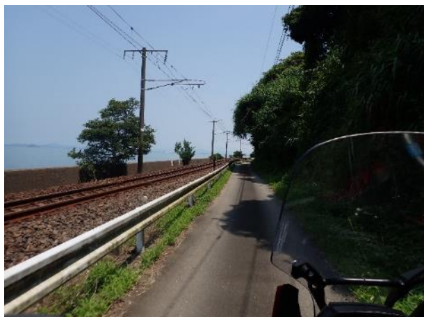
写真 386. 今度は、左におれんじ鉄道

「肥薩おれんじ鉄道」と並走する区間が多いのに、列車には会えない。本数が少ないんでしょうね。