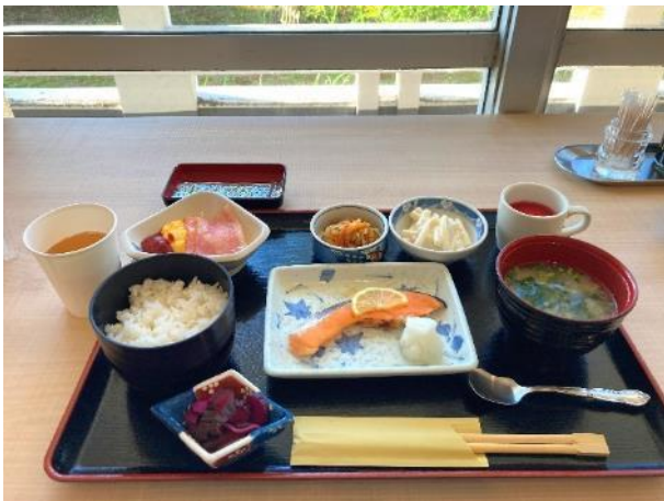
写真 357. 宿の朝食

朝食は、普通の旅館の朝食って感じであった。でも旅行中は、朝飯にコンビニパンが多いので、これはご馳走だった。いつもより、ゆっくりのスタートなので既に暑さを感じる。県道 43 号で海岸線を進む。羽島の岬と薩摩沖ノ島がよく見えた。