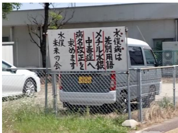
写真 377. 「水俣病」→「メチル水銀中毒症」

大迫地区の県道 56 号沿いに Google Maps に、「バイク天満宮」と書かれている所があるが、ここがどうしてこう言う名前になったのか？ネットで検索しても見つからなかった。鳥居に「交通安全」と書かれているだけであった。