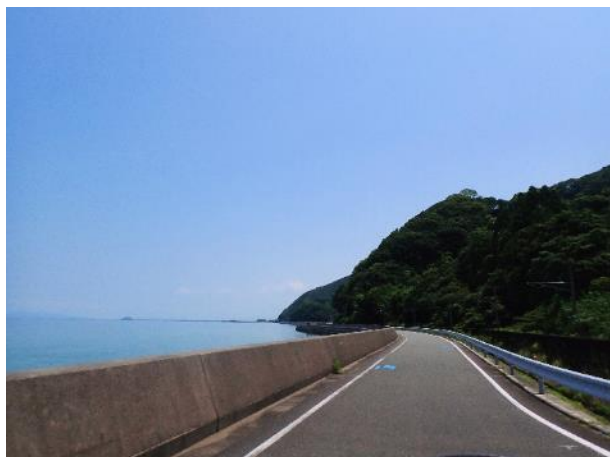
写真 384. 左は八代湾、右はおれんじ鉄道