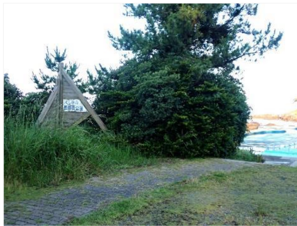
写真 354. すぐ横は「くしきの長崎鼻公園」