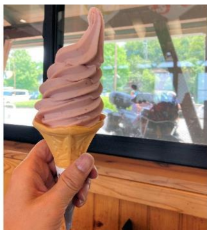
写真 391. いちごソフトとアフリカツイン