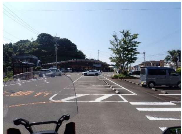
写真 370. 道の駅「黒之瀬戸だんだん市場」

この辺り出水市は、鹿児島県最後の町で鶴の飛来地で有名なところ。国道 3 号に戻り米ノ津川の米ノ津橋を渡る時、県境の山々が見えた。少し走ると九州 5 県目の県の熊本県に入った。