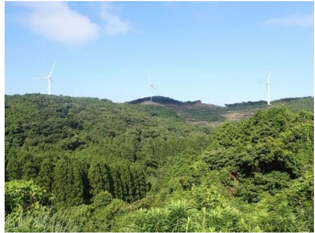
写真 360. 尾根には発電風車が並ぶ