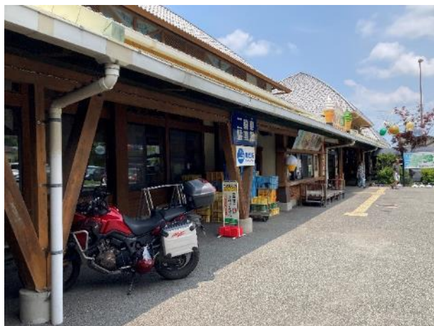
写真 389. 道の駅「竜北」

国道 3 号線沿いの道の駅「竜北」に入って、昼休み。バイクは無理矢理日陰に停めさせて貰った。昼飯は、やはり“暑いときのカレー”で、熊本名物の吉野梨が入った「吉野梨カレー」を食べた。梨のペーストが入っているから、まろやかな風味。美味しかった。食後にいちごソフトクリームで身体を冷やしてから、出発。