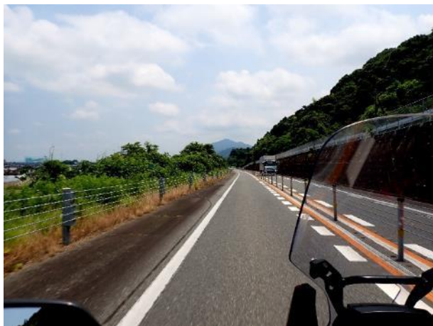
写真 387. 九州道も狭い道

八代の市街が近づき球磨川を渡るところから混みそうだったので、九州自動車道を八代南インターから八代インターまでひと区間乗った。この暑さだと渋滞にはまると、死んでしまうかもしれないという心配からね。