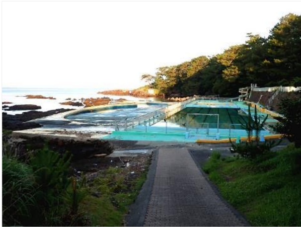
写真 355. 海辺に楽しそうなプールがある