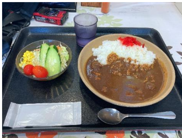
写真 390. 「吉野梨カレー」