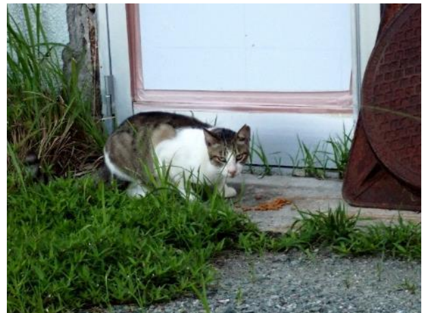
写真 356. 餌を貰っている地域ネコ

朝食は、普通の旅館の朝食って感じであった。でも旅行中は、朝飯にコンビニパンが多いので、これはご馳走だった。いつもより、ゆっくりのスタートなので既に暑さを感じる。県道 43 号で海岸線を進む。羽島の岬と薩摩沖ノ島がよく見えた。