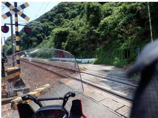
写真 385. 踏切で、線路と場所交代