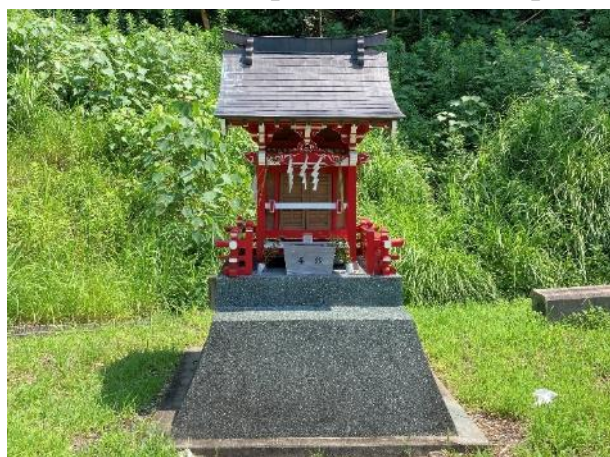
写真 379. バイク天満宮 (2)