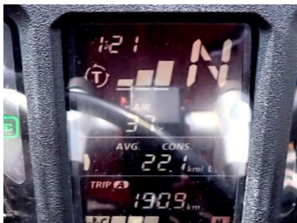
写真 393. 温度計が 37℃をさす

国道 3 号で宇城市に入り、隣の宇土市で国道 57 号に入る。遂に温度計が 37℃を示す。意識が遠のく暑さの中、住吉海岸公園に着く。