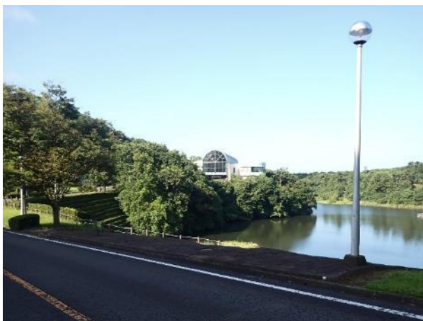
写真 361. 「川内原子力発電所展示館」