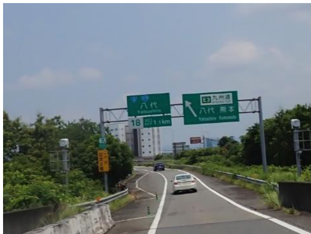
写真 388. 八代インターで降りる