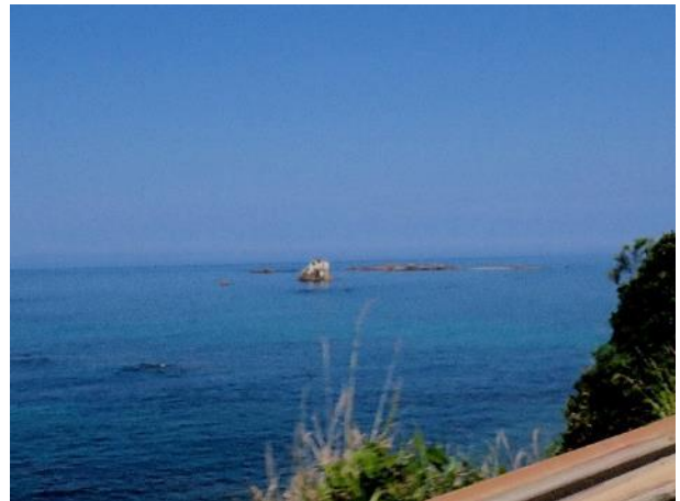
写真 368. 牛之浜景勝地

「牛之浜景勝地」等を横目に北上し、阿久根で国道 389 号に入り、黒之瀬戸大橋を渡って長島に渡った。そして、道の駅「黒之瀬戸だんだん市場」で U ターンして戻ってきた。ただ長島に渡ってみたかったです（笑）。