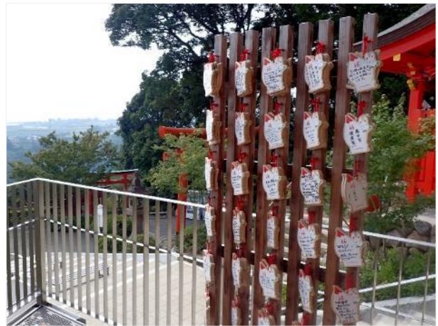
写真 510. 「絵馬」ならぬ「絵狐」

下ってから、きれいな「楼門」や、鳥居の外の門前町を見学。10 時過ぎだが観光客はほとんど居ない。観光バスなどが着くにはまだ早いのかな？ 県道 282 号は行きも通ってきたが、左右に巨大な朱色の灯籠が立っている。