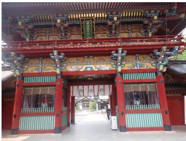
写真 511. 絢爛豪華な「楼門」