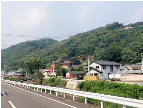
写真 501. 山の上まで祐徳稲荷

国道 444 号もいつの間にか国道 207 号となり、鹿島市に入ってから、友達のお勧めの祐徳稲荷神社に寄り道をする。県道 282 号進むと門前町の参道が有り、それを過ぎた神橋のたもとにバイクを停めて、見学した。自称「日本三大稲荷」に数えられる（少なくとも五大稲荷には入りそう）、大きな稲荷神社。奥の院までは結構登ります。