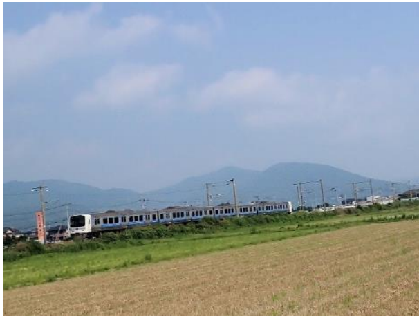
写真 499. JR 長崎本線 811 系