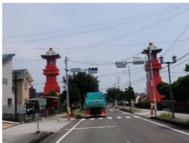
写真 514. 国道にある巨大な灯籠

国道 207 号に戻り、有明海沿いを南下して道の駅「鹿島」に寄る。ここは、大きな干潟が有名で、いろいろな干潟イベントが行われる場所。干潟の展望台に上がったが、またしても満ち潮の時間帯で、干潟は見物できず。館内には、古い写真や手作りの木彫りのムツゴロウやガタスキー（押し板）が展示してあった。