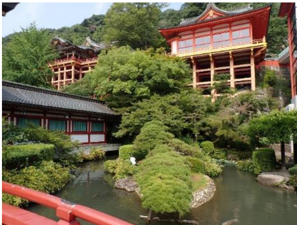
写真 507. きれいな庭園になっている