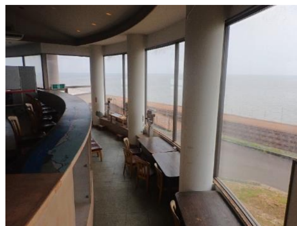
写真 516. 干潟展望台