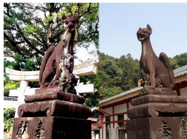
写真 504. お稲荷さんと言えば狐