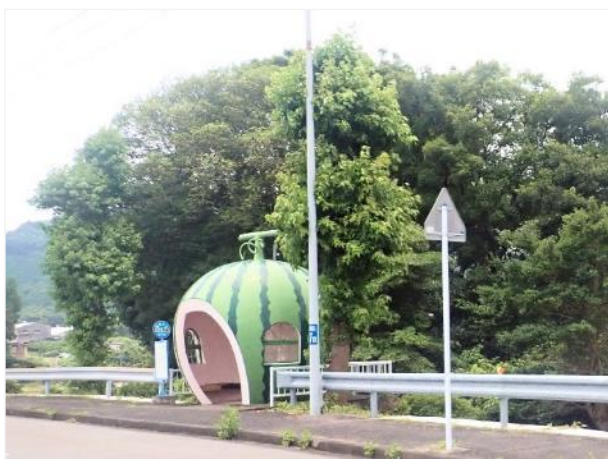
写真 527. 「スイカバス停」有り

国道 207 号はそのまま、長崎県に突入。これで、今回の旅の九州全県（沖縄は除く）に入ったことになる。この一帯は、バス停が巨大フルーツになっているので有名な道路だ。道端に突然現れるので写真に収めるのも大変。