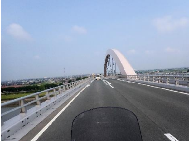
写真 493. 有明筑後川大橋を渡る