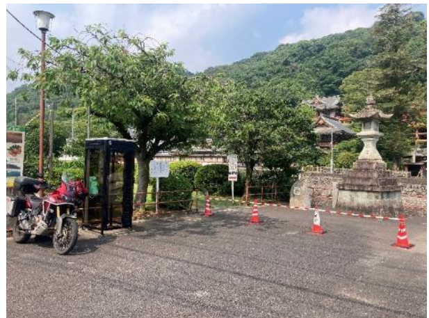
写真 502. 神橋のたもとに駐車