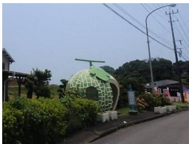
写真 526. 長崎県突入「メロンバス停」有り

国道 207 号はそのまま、長崎県に突入。これで、今回の旅の九州全県（沖縄は除く）に入ったことになる。この一帯は、バス停が巨大フルーツになっているので有名な道路だ。道端に突然現れるので写真に収めるのも大変。