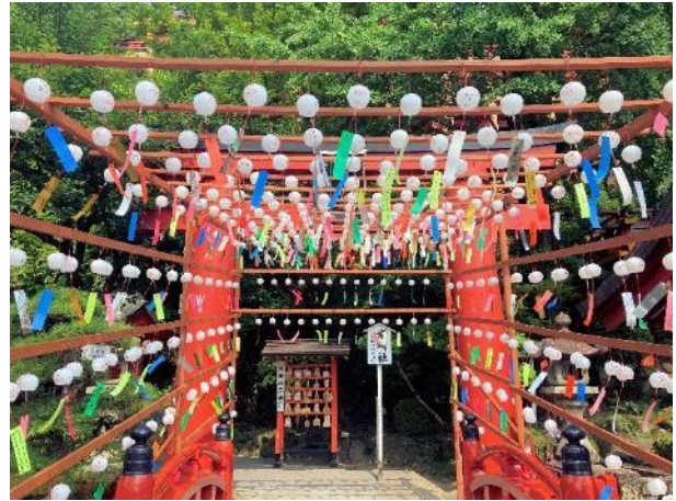
写真 506. 最近流行の風鈴トンネル