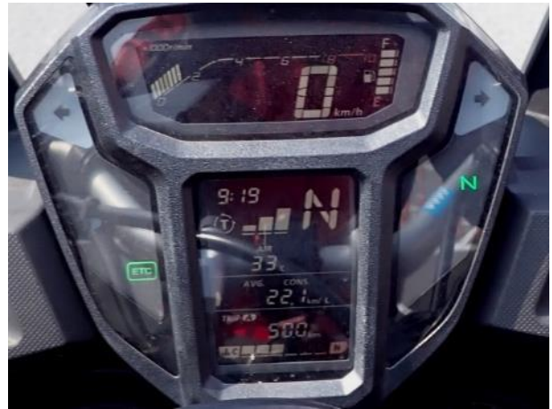
写真 500. 朝から 33℃

国道 444 号もいつの間にか国道 207 号となり、鹿島市に入ってから、友達のお勧めの祐徳稲荷神社に寄り道をする。県道 282 号進むと門前町の参道が有り、それを過ぎた神橋のたもとにバイクを停めて、見学した。自称「日本三大稲荷」に数えられる（少なくとも五大稲荷には入りそう）、大きな稲荷神社。奥の院までは結構登ります。