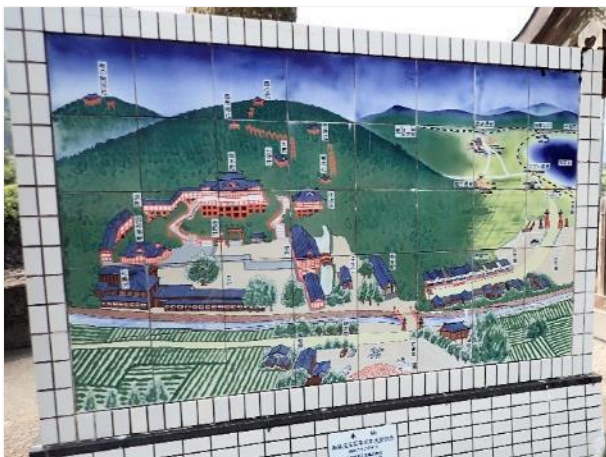
写真 503. 祐徳稲荷は大きな神社です