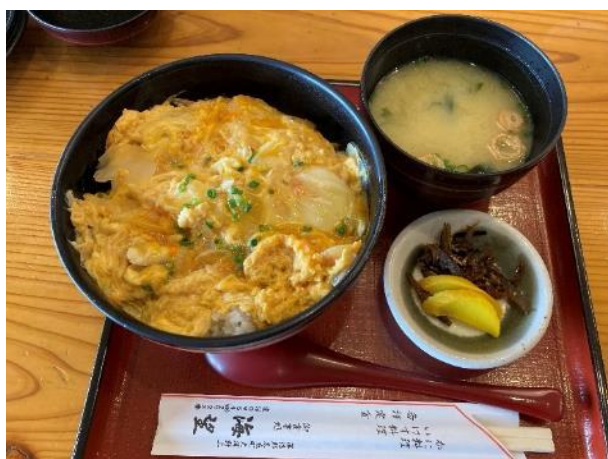
写真 525. 玉子丼のような「カニ丼」