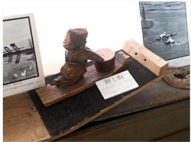
写真 518. ガツスキー（押し板）と漁師

国道を少し南下すると、今度は道の駅「太良」がある。ここには、佐賀を代表する民謡「岳の新太郎さん」の主人公の銅像が立っている。関東ではなじみのない民謡だ。