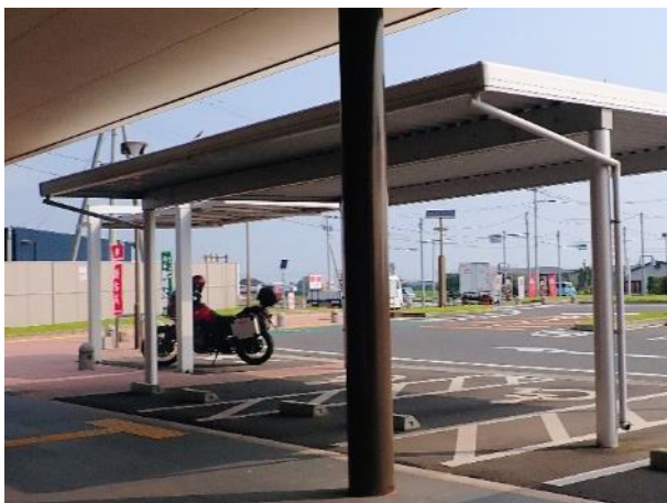
写真 497. 道の駅「しろいし」