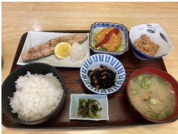
写真 491. 朝食もしっかり頂きました

宿の前の国道 208 号を北上して柳川西インターから自動車道の有明海沿岸道路（国道 208 号バイパス）に乗って海岸寄り走る。まもなく筑後川とその分流の早津江川を渡る。遂に、九州 6 県目の佐賀県に入った。ここで、国道 444 号に入る。