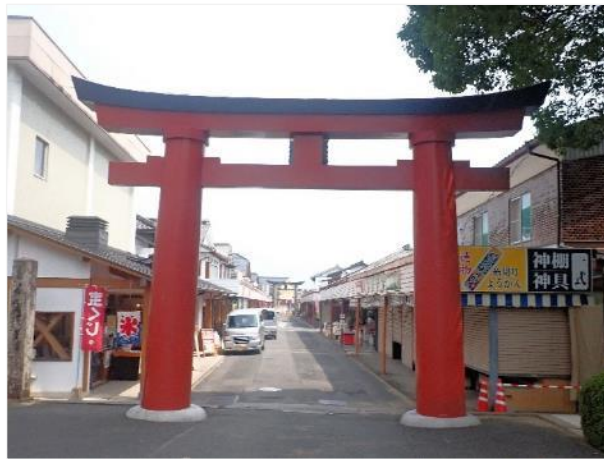
写真 512. 鳥居の向こうは門前町