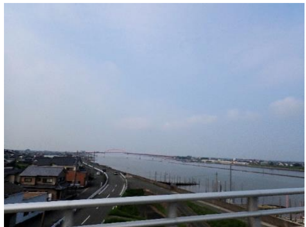
写真 492. 筑後川は大きい