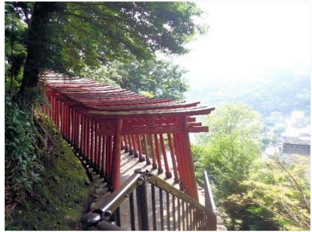
写真 508. とにかく、狐と鳥居が多い

石段を上がり、いくつかの社をお参りしながら、奥の院まで行きます。途中の本殿には休憩所があり、ここまではエレベーターもあるようだ。