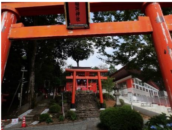
写真 509. 奥の院まで頑張りました

石段を上がり、いくつかの社をお参りしながら、奥の院まで行きます。途中の本殿には休憩所があり、ここまではエレベーターもあるようだ。