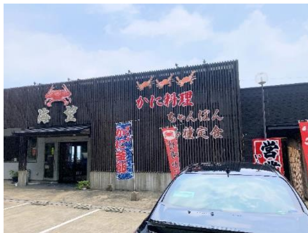
写真 524. 国道沿いのレストラン「海望」