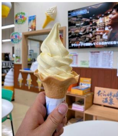
写真 523. ミンソフトクリーム

おなかが空いたので、国道沿いに「かに料理」の看板を掲げる食堂があったので入ってみた。地元の人が気軽に入る食堂で、多くの客はちゃんぽんを食べている。ワタリガニにしか見えない「竹崎カニ」は、とても高いので、リーズナブルな「カニ丼」を頼んでみた。出てきたのは、ほとんどカニの見当たらない「玉子丼」だった。まあ、味は悪くなかったので許そう。