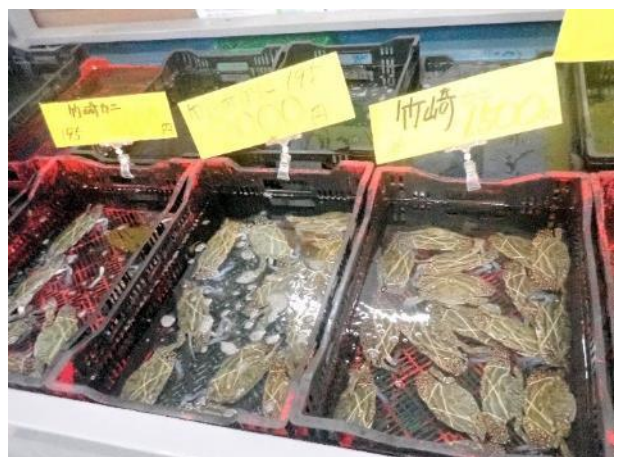
写真 522. 名物「竹崎カニ」

名物「竹崎カニ」は、見た目ワタリガニであるが、なかなかいい値段。カニは食べないで、もう一つの名物ミカンに因んでミカンソフトを頂いた。普通に美味しかった。その後、引き続き国道 207 号を南下。