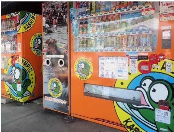
写真 519. ムツゴロー柄の自販機