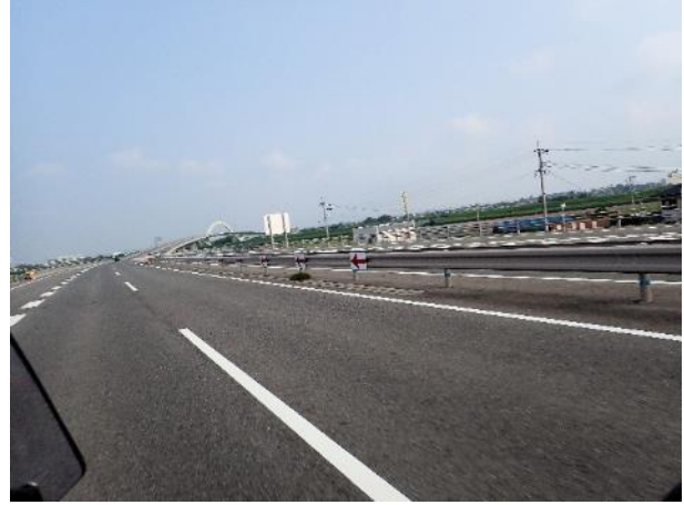
写真 494. 有明早津江川大橋を渡る