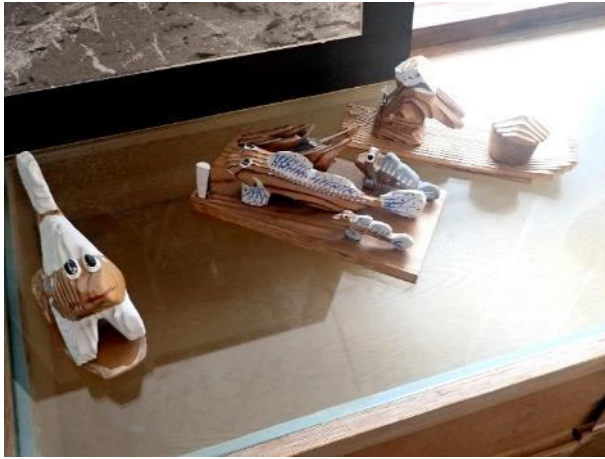
写真 517. 木彫りの「ムツゴロー」