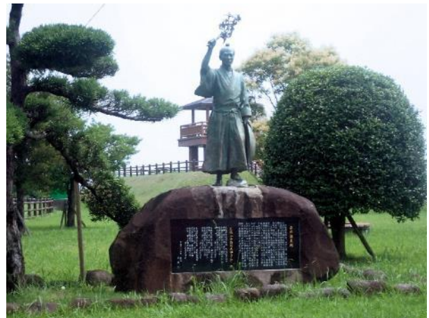
写真 520. 岳の新太郎像