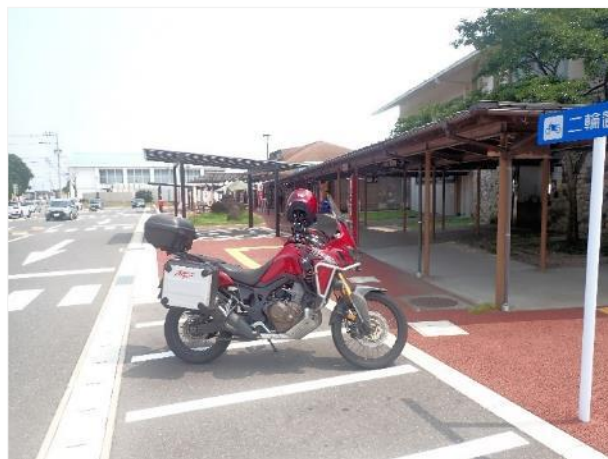
写真 515. 道の駅「鹿島」

国道 207 号に戻り、有明海沿いを南下して道の駅「鹿島」に寄る。ここは、大きな干潟が有名で、いろいろな干潟イベントが行われる場所。干潟の展望台に上がったが、またしても満ち潮の時間帯で、干潟は見物できず。館内には、古い写真や手作りの木彫りのムツゴロウやガタスキー（押し板）が展示してあった。