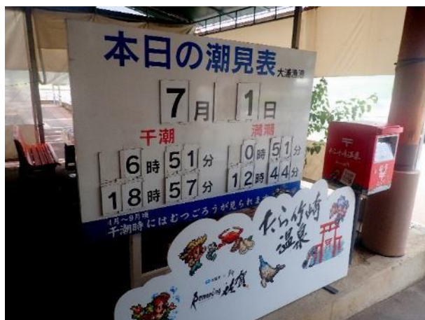
写真 521. 残念ながら、現在時刻 11 時 9 分

名物「竹崎カニ」は、見た目ワタリガニであるが、なかなかいい値段。カニは食べないで、もう一つの名物ミカンに因んでミカンソフトを頂いた。普通に美味しかった。その後、引き続き国道 207 号を南下。