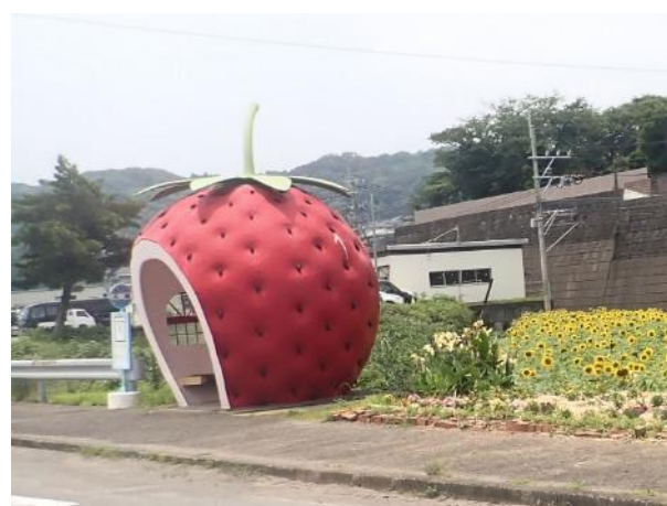
写真 528. 「イチゴバス停」有り