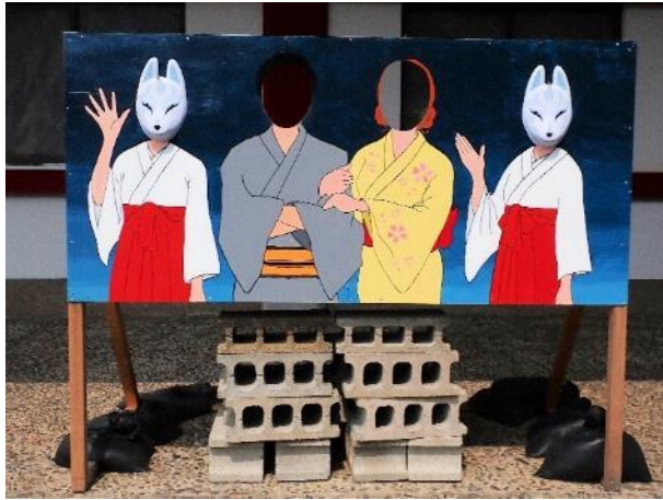
写真 505. 子供用？のブロックがなんとも・・・