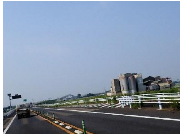
写真 496. 六角川大橋とカントリーエレベーター

国道 444 号も新しい無料の自動車道が海側を並走するので、芦刈インターから道の駅「しろいし」までそちらを走った。それから国道 444 号の旧道に戻り、先に進む。道の駅はまだ開店前なので、手持ちのジュースで水分補給だけして先に進む。しばらくすると、右手にカントリーエレベーターの施設、奥に六角川大橋が見えてきた。しばらく国道は田園地帯を曲がりくねって進む。