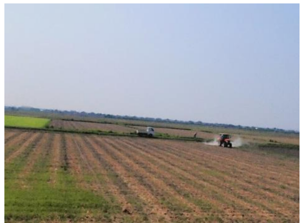
写真 498. 田園風景が続く