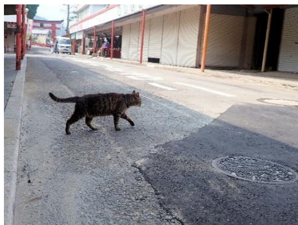
写真 513. 門前町には、狐が化けた猫が歩く