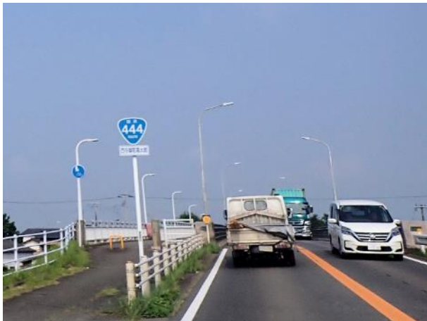
写真 495. ぞろ目国道 444 号