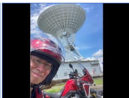
内之浦 宇宙空間観測所