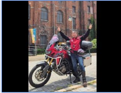
門司赤煉瓦ブレイス