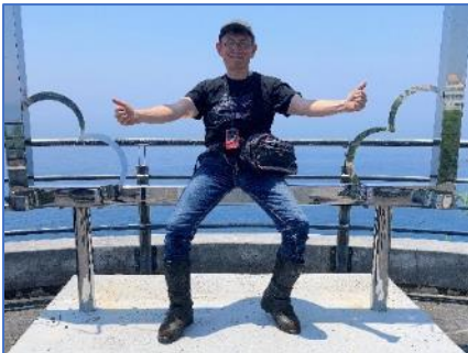
北緯 33 度線展望台