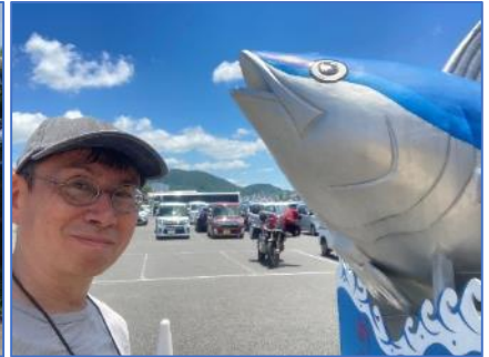
枕崎お魚センター