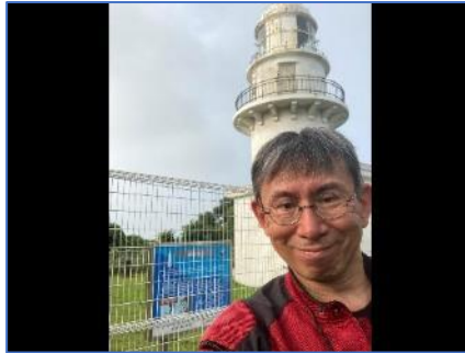
樺島灯台（野母埼燈台）