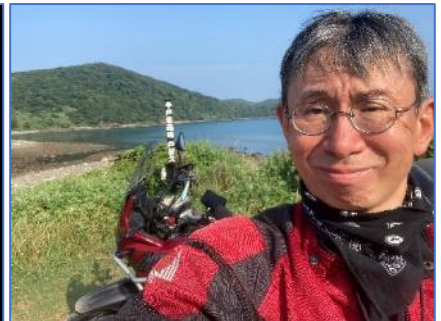
平戸最西端 戸屋久