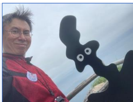
鶴御埼のさいとうたん