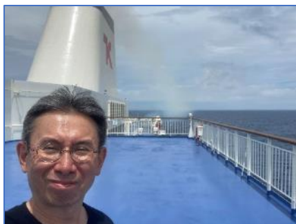
門司行きフェリー